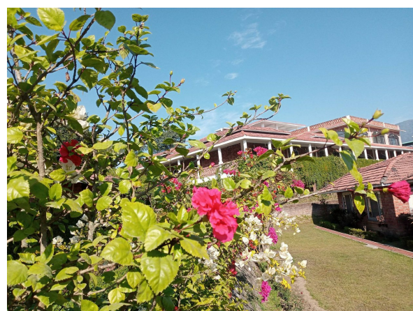
Foto: Swami Rama Sadhaka Grama ashram in de zomerzon.